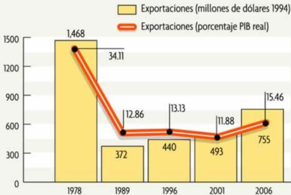
Gráfico: LA PRENSA/LUIS GONZÁLEZ S.

■ En el 2006 por primera vez en su historia Nicaragua logró superar los mil millones de dólares en exportaciones a valor nominal, pero en términos reales estas exportaciones representan 755 millones de dólares de 1994. Esto significa el 50 por ciento de las exportaciones de 1978, en dólares de 1994.